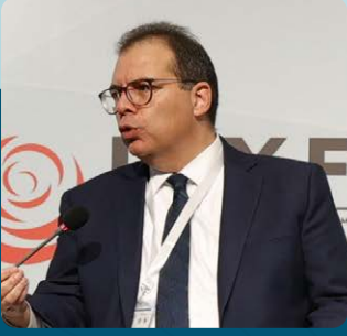
Sayın Ahmed Elsaid Mısır Ulusal Bankası Baş Yatırım Sorumlusu

"Bir şeyi düzeltmenin, sıfırdan başlamaktan daha zor olduğunu" vurgulayarak, KOBİ'lere yönelik kapsamlı desteği savundu; bu destek şunları içermelidir: