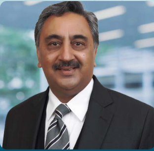
Sayın Ahmer Bilal Soofi İslam İşbirliği Teşkilatı Mütevelli Heyeti Üyesi ve Eski Pakistan Hukuk Bakanı.